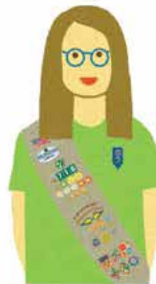
Seniors Grades 9-10