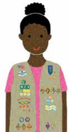
Cadettes Grades 6-8