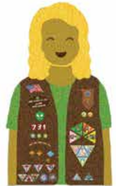
Brownies Grades 2-3