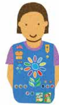
Daisies Grades K-1

Los parches de viajes y experiencias divertidas siempre van en la parte de atrás.