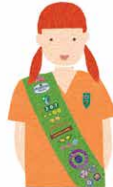
Juniors Grades 4-5