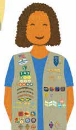
Ambassadors Grades 11-12

Need more help? Go to girlscouts.org/placement . ¿Necesita más ayuda? Visita girlscouts.org/placement .